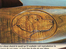
Le client choisit le motif qu'il souhaite voir reproduire la crosse de son arme, ce peut être la tête de son chien.