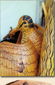
La bécasse inspire l'artiste qui a sculpté cet oiseau dans bien des instances de bois, tilleul, if, noyer, ardoise...

montrée dans un magnifique bois couleur miel. C'est de l'ardoise, un résineux, de son vrai nom pin cembro ou pin des Alpes, un arbre symbole de la haute-montagne qui habite les cimes et pousse en altitude bien au-delà de mille mètres.