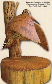
Pour représenter un mystérieux oiseau comme la dame au long bec, l'artiste était parfait.

Après avoir obtenu son certificat d'aptitude professionnel de menuisier en 1974, il se trouve un patron ébéniste. À partir